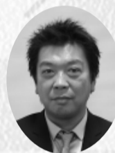
玉樹 喜美成 丸利玉樹利喜蔵商店(株)