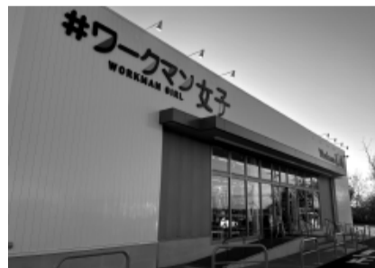
「#ワークマン女子」の文字が目印の店舗

また、商品マッサージと呼ばれる店内の整理整頓に力を入れており、店内のきれいさを保ち、商品が見やすい売り場になっています。インスタグラムでの情報発信にも力を入れており、商品の特徴や着こなし方も確認できます。