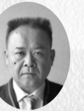
林 大輔 協業)肥田セラム(株)