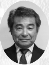
楓 陽光 大東亜窯業(株)