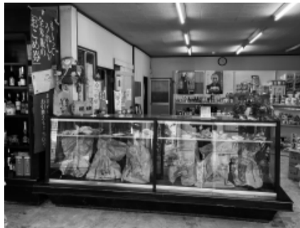
前面にコメを並べたショーケースを配置した店内

現在、配達が大半をしめていますが、店舗にも来てもらいたいとの思いから、商工会議所の専門家派遣制度を活用して、商品を見やすくするために棚のレイアウト変更や、コメの専門店と分かるようショーケースを利用して取り扱っているコメを前面に配置しました。また、来店された方にはコメについての豆知識も説明しています。