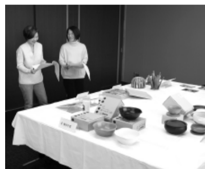
趣向を凝らした7事業者の商品を選定する審査員