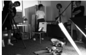
プロカメラマンが撮影する様子