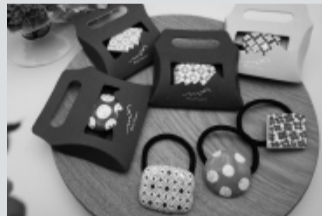
美濃焼ヘアゴムとパッケージ

実際に商品を見ながら、アドバイスを頂き、改めて当社の強みや特徴を考える事ができ、コンセプトに基づいたロゴとパッケージを完成させる事ができました。現在、イオンモール土岐内店舗の「TOKI MINOYAKI」、もととら東美濃にて販売中です。 ※デザインの委託は別途契約が必要になります。