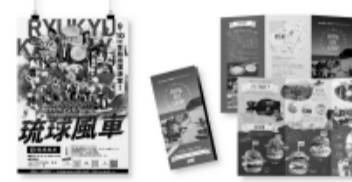
ヒガさんが制作したデザインの一部